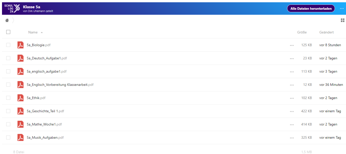
Abbildung 4 - Nextcloud via Schullog.in.de, Klasse 5a (Dirk Uhlemann)